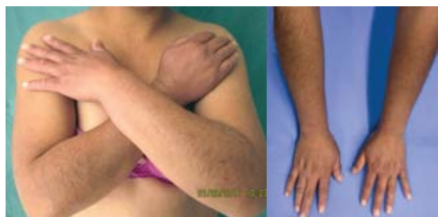
Fotografía 1. a) Paciente con prurigo actínico; b) tras 7 meses de tratamiento con talidomida.

El uso de la talidomida para prurigo actínico se describió en 1973 17 y actualmente se reconocen de manera inequívoca sus efectos benéficos en esta fotodermatosis. 4,19 (fotografías 1 y 2) Con una dosis inicial de 50 mg a 200 mg/día, y otra de 25 mg a 100 mg/semana de mantenimiento. 5