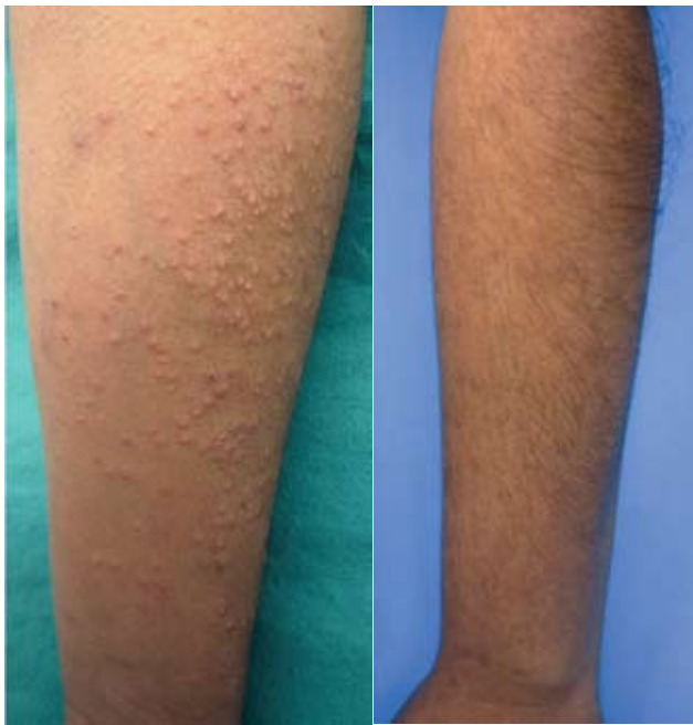
Fotografía 2. a) Paciente con prurigo actínico; b) tras 7 meses de tratamiento con talidomida.