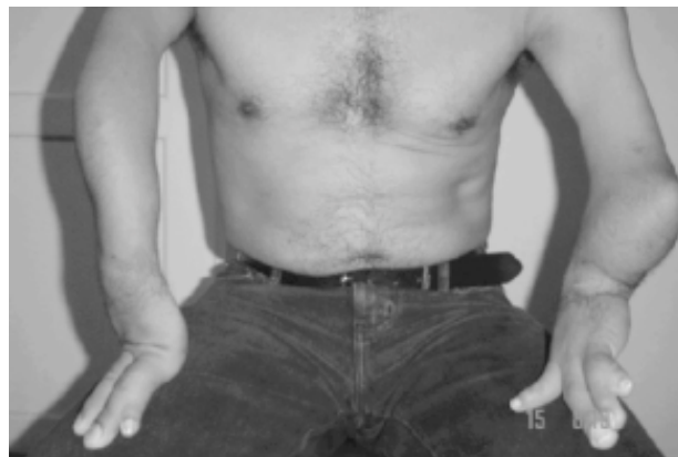
Figura N° 1 DISMELIA SUPERIOR ATRIBUIDA POR EL PACIENTE A LA TALIDOMIDA

Diez años después, la talidomida habría de ser proscrita porque se presentaron alrededor de 10.000 casos de focomelia total o parcial (dismelia), correspondientes al 1% de los hijos de las gestantes que la consumieron (fetos y neonatos sin extremidades o con ellas parcialmente desarrolladas, a veces con la apariencia de aletas –bebés delfines–), sin contar con cifras que reflejen la magnitud de las pérdidas gestacionales y otras malformaciones atribuibles a la administración de esta droga. En una entrevista reciente a un empleado del sector de la salud sobre su discapacidad (dismelia), éste la atribuyó sin certeza a la talidomida, recetada por un farmacéuta a las gestantes de su ciudad natal, donde por lo menos seis adultos con su edad aproximada (42 años) y su misma malformación, coinciden en afirmar que sus madres recibieron la misma medicación, y esto, aunque puede ser una coincidencia, ocurrió alrededor de 1960, época en la que la droga fue proscrita (1) (Figura N° 1).