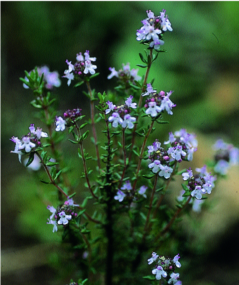
Thymus vulgaris .