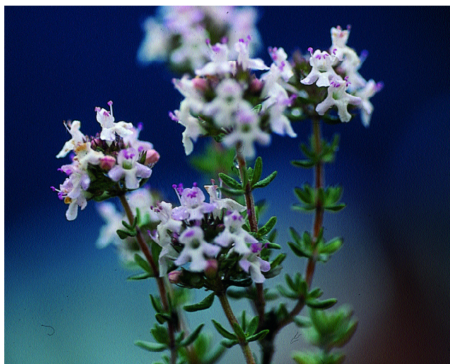
Thymus vulgaris .